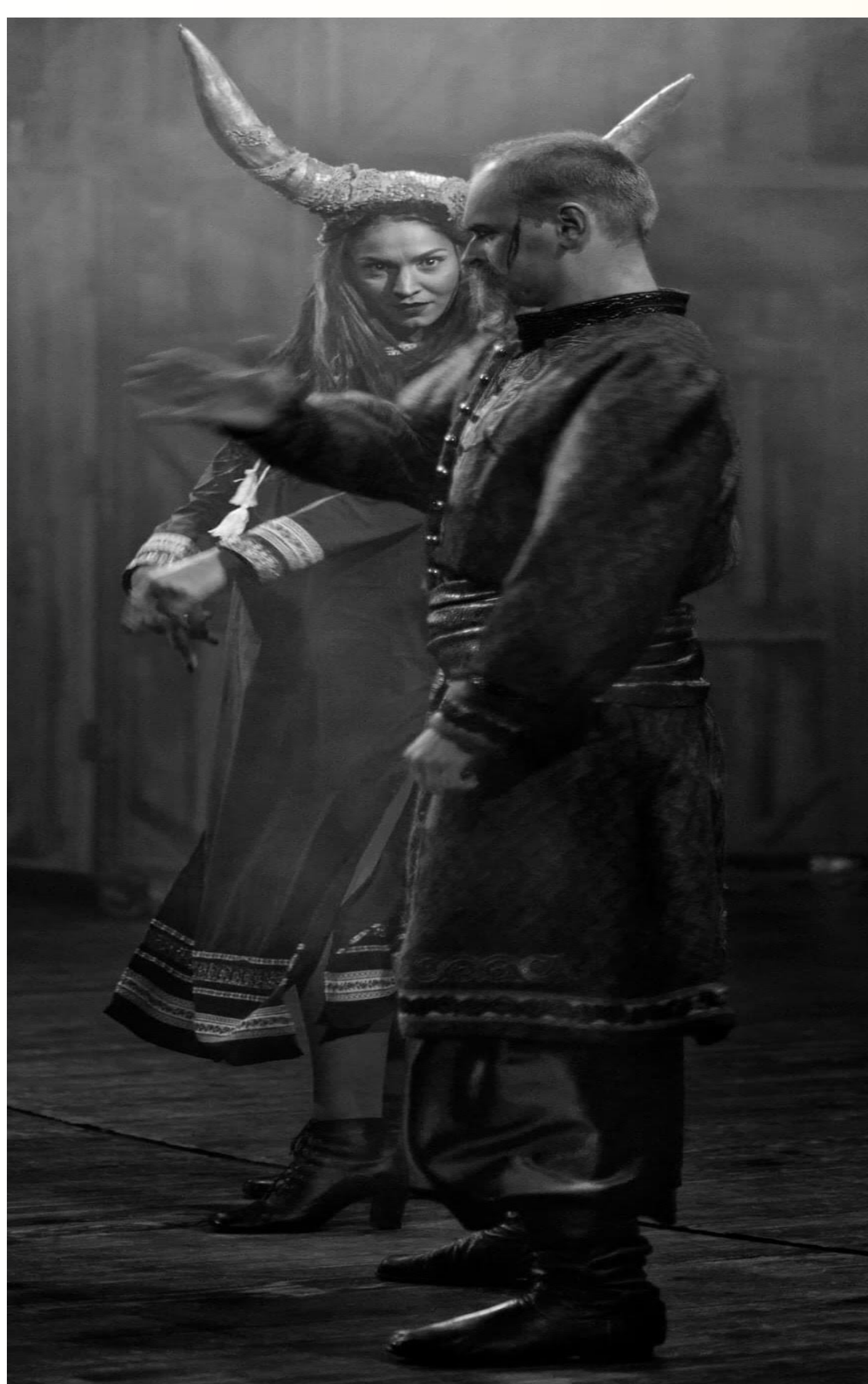
Рис. 2 Вистава “Конотопська відьма”